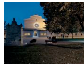
Abbazia vista notturna