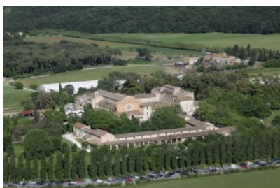
La quinta edizione di Herbaria prenderà il via