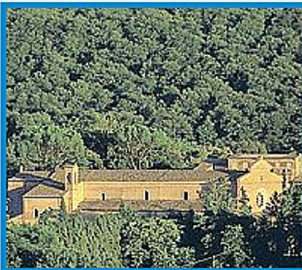
IMPONENTE L'esterno dell'Abbadia di Chiaravalle di Fiastra (Macerata)