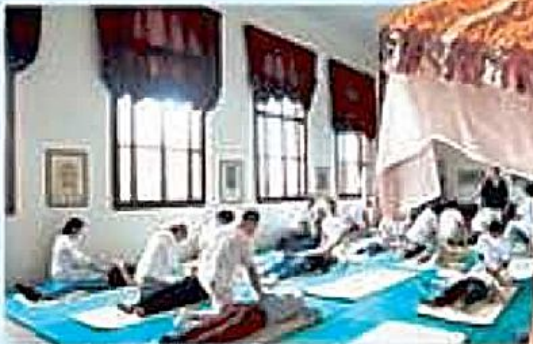
RELAX A destra la cerimonia del the; a sinistra, seduta di massaggi