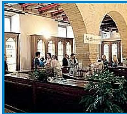
RELIGIOSA 'Monastica', la sezione riservata ai monasteri